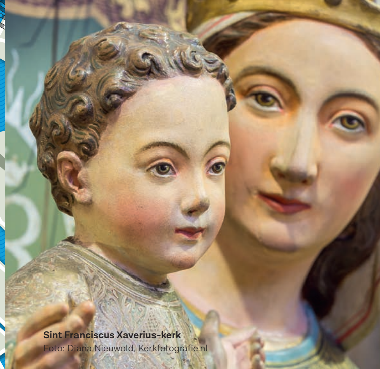
Sint-Franciscus Xaverius-kerk