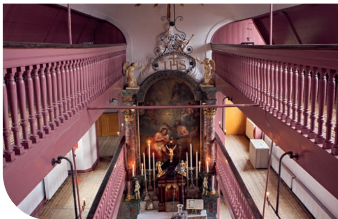
↑ Ons' Lieve Heer op Solder

Holy City Amsterdam zet het unieke katholieke erfgoed van de stad in de schijnwerpers in het licht van de viering van 750 jaar Amsterdam. Via stadswandelingen brengen we bewoners en bezoekers dichterbij de verhalen van geloof, veerkracht en culturele identiteit die Amsterdam door de eeuwen heen hebben gevormd – en laat je verrassen door een kant van de stad die je nog niet kende.