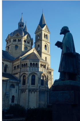
Munsterkerk met op de voorgrond het standbeeld van Pierre Cuypers.

Het oudste deel van de kerk is de klaverbladvormige koorpartij van vóór 1218, die we ook zien bij verwante basilieken in Keulen, Neuss en Speyer. Het schip verrees tussen 1220 en 1244 met al vroege gotische elementen zoals kruisgewelven. De westbouw werd tussen 1244 en 1260 gebouwd en bleef onvoltooid, waarschijnlijk door de slechte bodemgesteldheid. Architect Pierre Cuypers heeft de Munsterkerk rond 1850 gerestaureerd, waarbij hij zich een beeld had gevormd hoe gotische dan wel romaanse kerken eruit hoorden te zien. Cuypers verving alle 'onzuivere' onderdelen, zoals de barokke klokkentoren boven de westzijde, door torens en aanbouwen die hij als 'zuiver-romaans' zag. Tussen 1959 en 1964 werd het door Cuypers aangebrachte neogotische interieur weer verwijderd. Bij latere herstellingen, zoals na de aardbeving van 1992, werd de kerk steeds weer volgens Cuypers' oorspronkelijke plan gerestaureerd. Aan de zuidzijde van de Munsterkerk bevindt zich het Cuypersmonument van beeldhouwer August Falize uit 1930.