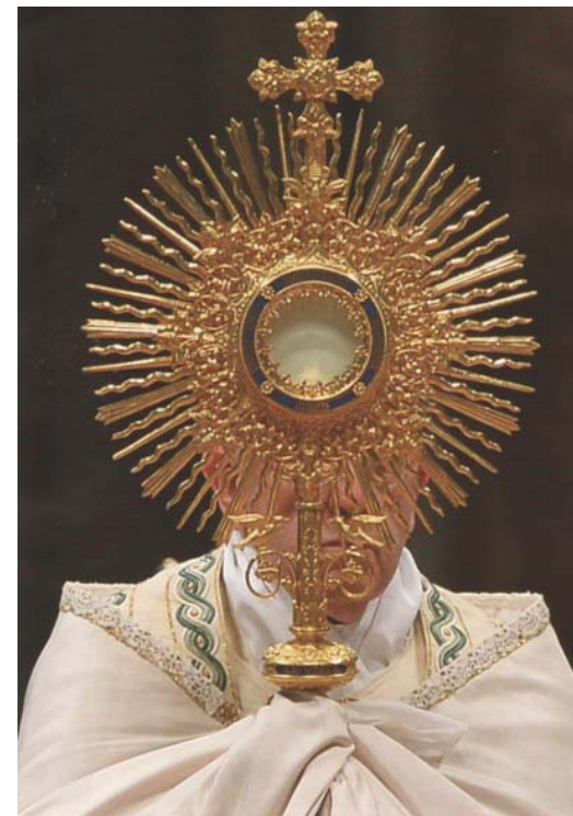
Paus Franciscus, juni 2013 Sint-Pietersbasiliek

Nederland wordt Sacramentsdag meestal op de tweede zondag na Pinksteren gevierd.