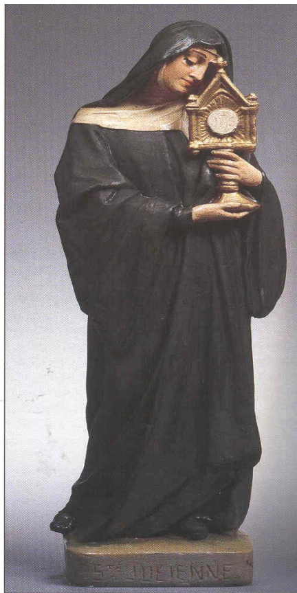
Heilige Juliana van Cornillon

Tegenwoordig Verscheidene pausen hebben zich positief uitgelaten over de aanbidding. In zijn encycliek Mysterium Fidei (1965) riep paus Paulus VI de bisschoppen op 'woorden noch moeite te sparen om de aanbidding van de Eucharistie te bevorderen'. Paus Johannes Paulus II zei iets soortgelijks in Ecclesia de Eucharistia (2003).