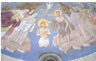
plafondschildering Doopkapel van OLVrouw Tenhemelopneming

Rondleidingen starten telkens om 14.30u. Voor rondleidingen buiten deze tijden en voor rondleidingen speciaal voor kinderen kunt u gerust contact opnemen met het secretariaat aan de Dorpsstraat. Zie voor adres en telefoonnummer de achterzijde van de folder.