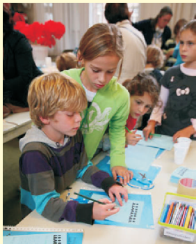
kaarten maken voor zieke kinderen