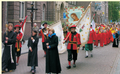
in processie naar Maria in de Sint-Jan