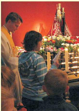
samen zingen en iets meenemen voor thuis