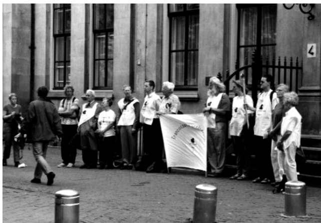
Een wake van de Vredeswacht. (Bij het Ministerie van Defensie te Den Haag)

Maak mij tot een werktuig van Uw vrede, Laat mij waar haat is liefde brengen Waar wrok is, vergeving Waar tweedracht is, eenheid Waar twijfel is, geloof Waar wanhoop is, vertrouwen Waar duisternis is, licht Waar verdriet is, vreugde Maak mij tot een werktuig van Uw vrede.