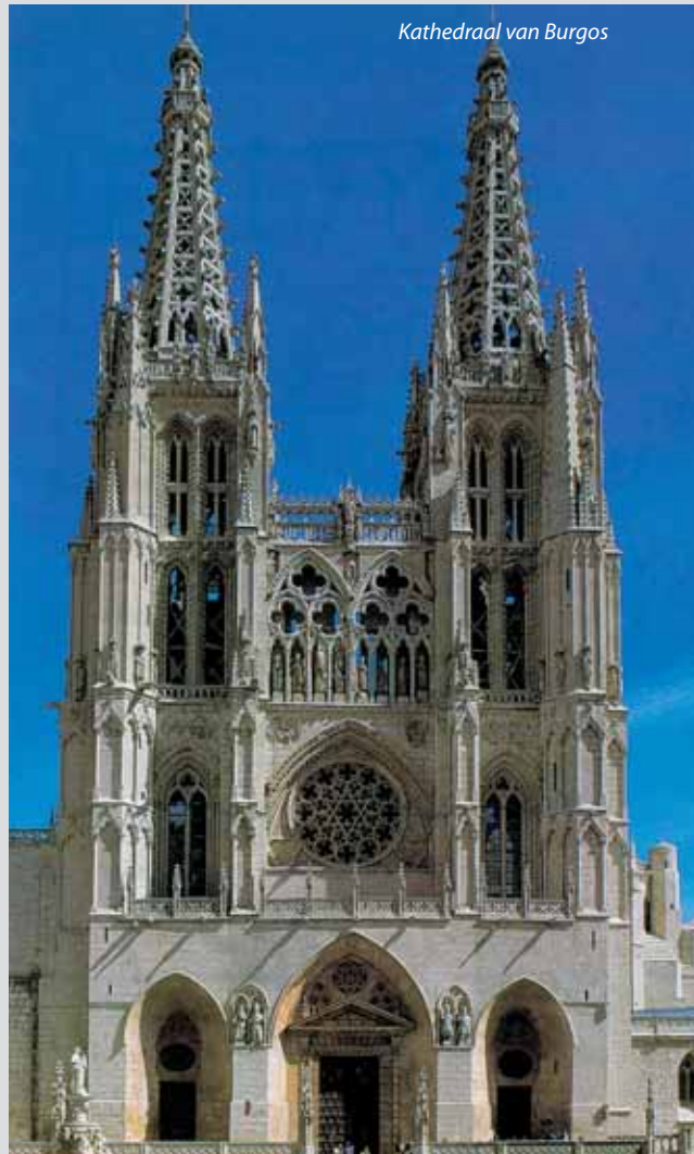
Kathedraal van Burgos

Dag 8: Van Saintes naar Poitiers, Orléans: lunchpauze. Verder naar Parijs, Lille en Marke: avondhalte. Afstapplaatsen.