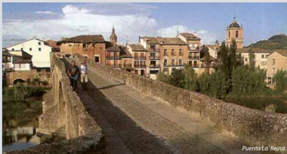
Puerta La Reina

De pelgrimstochten naar Santiago betekenden een enorme stimulans voor de uitwisseling van kennis tussen wetenschappers, kunstenaars en schrijvers. Santiago was in de Middeleeuwen dan ook een belangrijk economisch en cultureel middelpunt. Nu is Santiago de Compostela de hoofdstad van Galicië en één van de mooiste steden van Spanje.