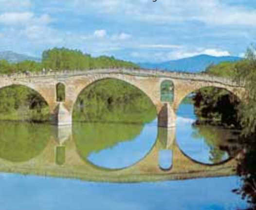
Dorpje aan de St.-Jacobsweg