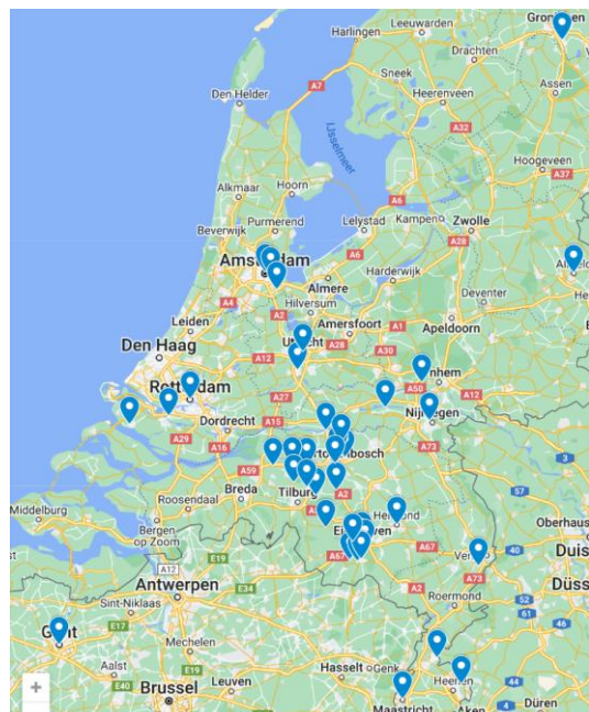
Deelname Moederdag voor Maria 2023

Sinds de start in 2009 zijn er meer dan 100 activiteiten geweest waaraan circa 50.000 kinderen in Nederland en deels ook in Vlaanderen hebben deelgenomen. Ook heeft de stichting diverse kindermaterialen ontwikkeld (zowel in print als digitaal). In de 2021 editie van het kinderrozenkransboekje is veel van de opgedane ervaring van de afgelopen jaren verwerkt. Sindsdien zijn nieuwe materialen ontwikkeld om kinderen het Onze Vader en Weesgegroet te leren zoals een staande kaart voor op de eettafel en een lamineerde kaart met beide gebeden. In 2023 volgde een Kerst-Kwartetspel met prachtige illustraties door Susanna Hüsstege.