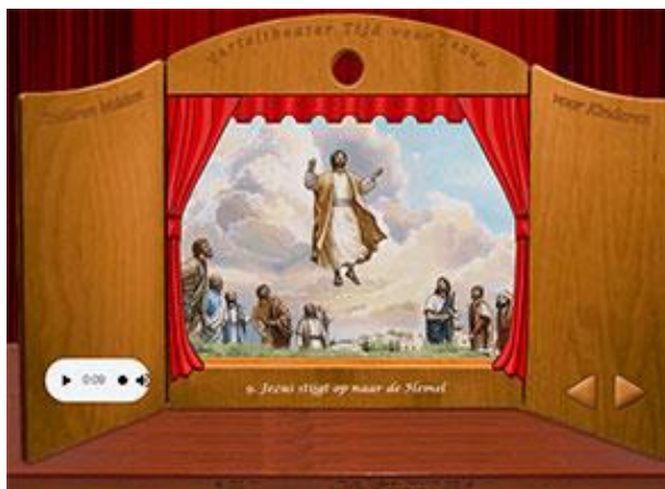
Verteltheater Tijd voor Jezus