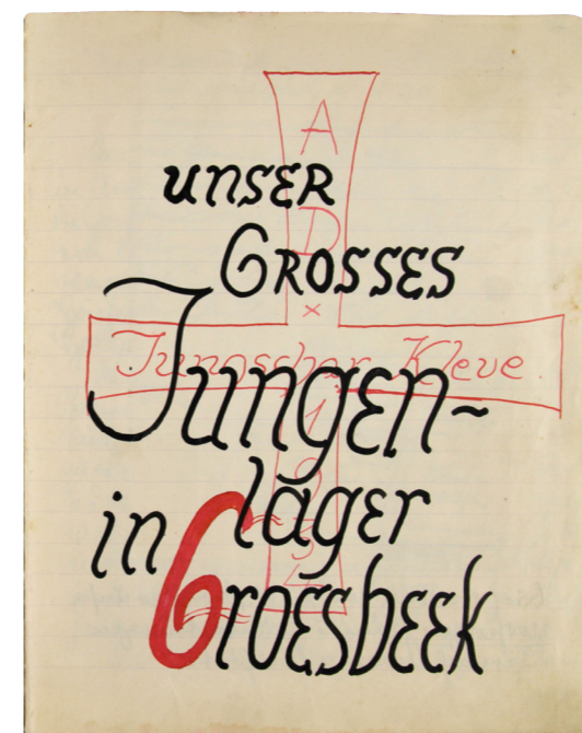
Tekening en foto uit dagboek 13 gemaakt door Karl Leisner.