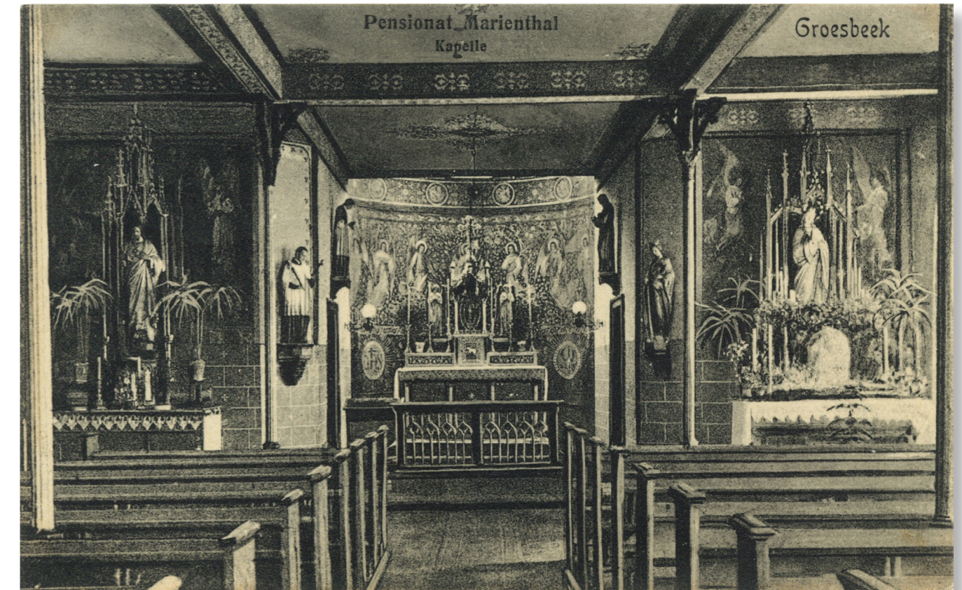
Zo moet de kapel er in 1934 ongeveer hebben uitgezien.

Alle genodigden worden van harte uitgenodigd in Gasterij 't Groeske (zaal direct onder de kapel) voor koffie/thee en appelgebak.