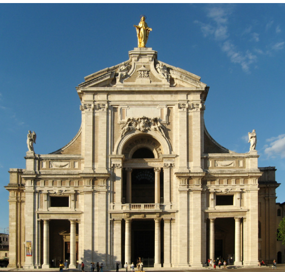
Santa Maria degli Angeli