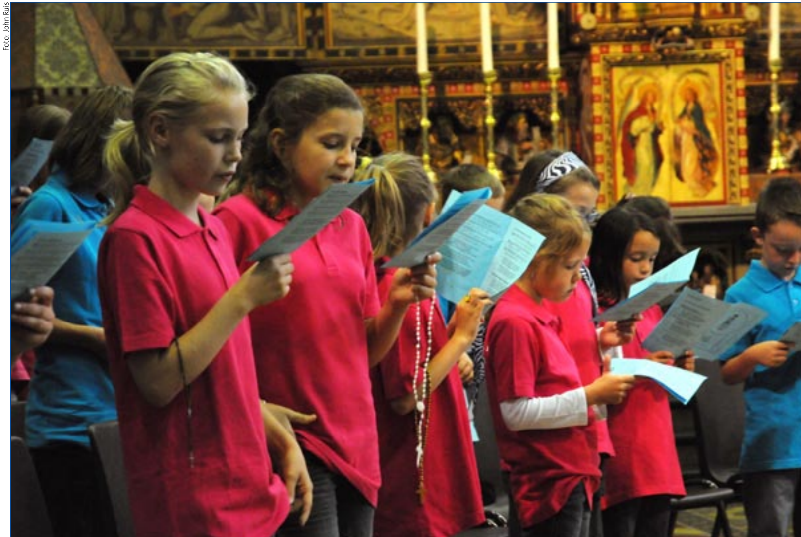
Kinderen bidden de rozenkrans in de Sint-Nicolaasbasiliek in IJsselstein.